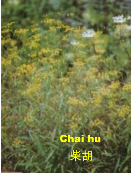
Chai hu 柴胡