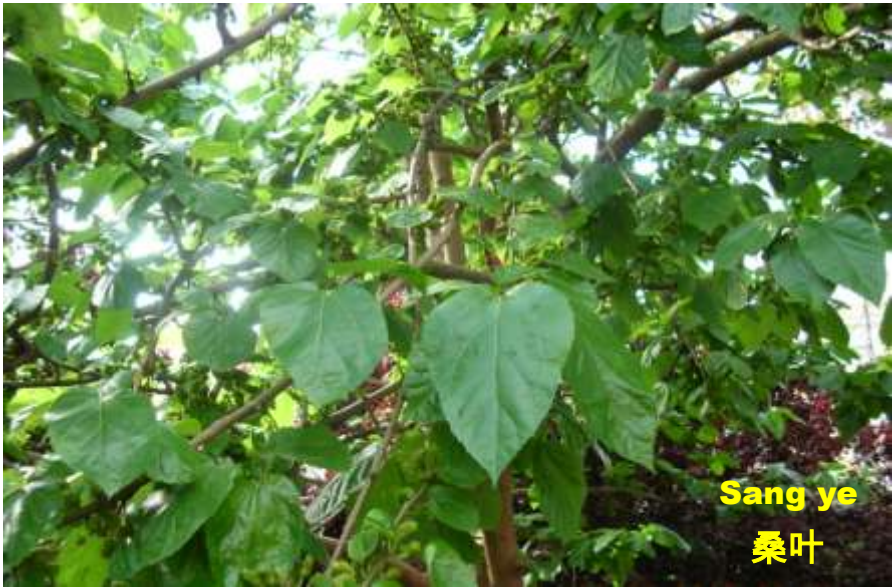
Sang ye 桑叶