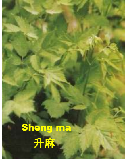
Sheng ma 升麻