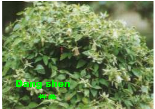
Dang shen 党参