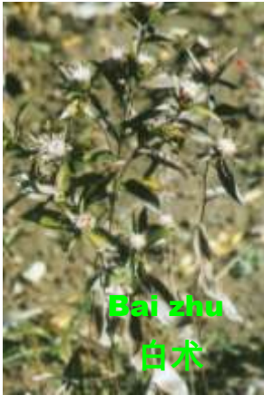
Bai zhu 白朮