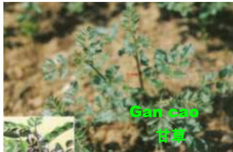
Gan cao 甘草