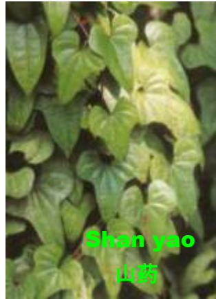
Shan yao 山药