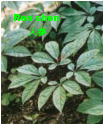
Ren shen 人参