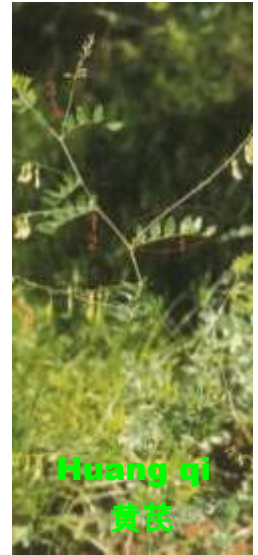
Huang qi 黄芪